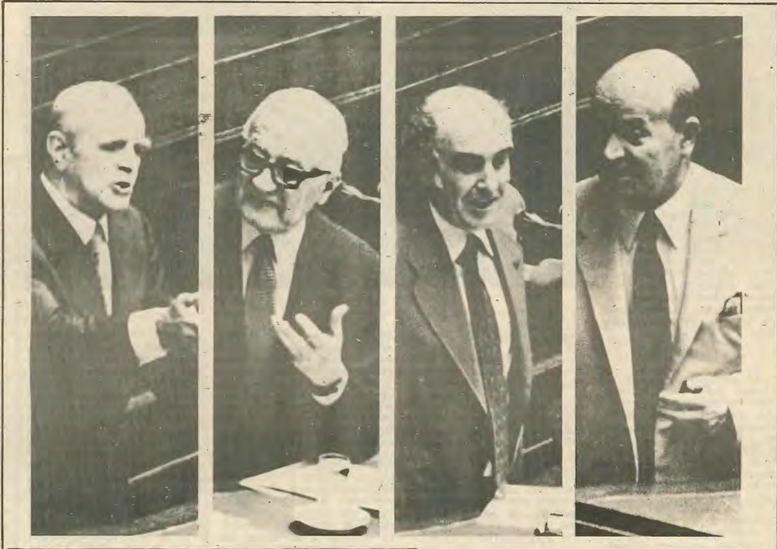
...νάντια στις Βάσεις. Και θέβαια δεν αρκεί να άκουσται το σύνθημα στη Βουλή. Η σωστή πορεία είναι εκείνη των πλατειών κινητοποιήσεων με αίτημα το δημοψήφισμα. Έτσι τα κόμματα της αριστεράς θα πρέπει να προχωρήσουν στη διενέργεια κινητοποιήσεων με σκοπό να εμπλέξουν άμεσα τον λαϊκό παράγοντα στον αγώνα. Είναι ο μόνος τρόπος για να γίνει σωστή έκμετάλλευση ενός σωστού συνθήματος. Αλλιώς, ο Καραμανλής θα περάσει τη φιλοαμερικάνικη του πολιτική στο θέμα των Βάσεων χωρίς ούσιαστική αντίδραση από την αριστερά.

Επομένως, το σύνθημα για δημοψήφισμα μπορεί ν' αποτελέσει πλατφόρμα γύρω από την όποια να συσπειρωθούν πλατείες μάζες για τον αγώνα ε-